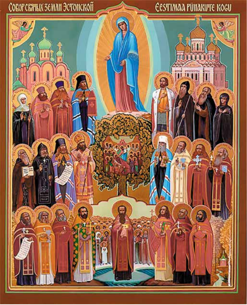
Художник-иконописец Леонид Соколов

Собор был установлен 22 июля 2002 года указом Патриарха Москов-