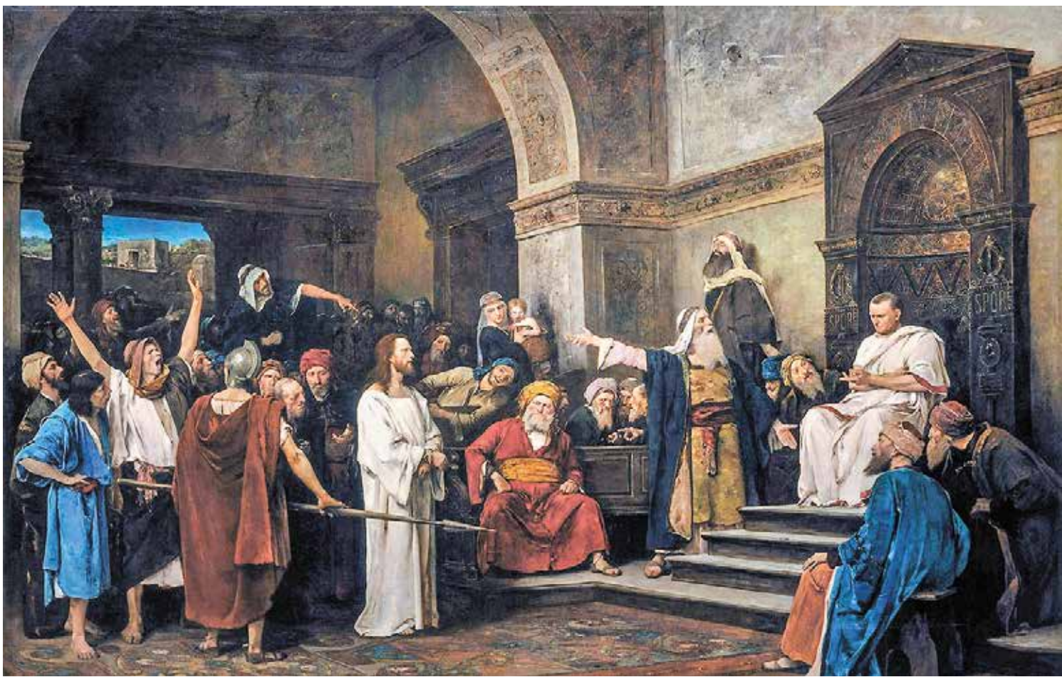
«Христос перед Пилатом». Михай Мункачи, 1881

Многие исследователи предполагают, что суд над Пилатом в Риме так и не состоялся, потому что Калигула сослал его во Вьенну на юге Франции, где, согласно Евсевию Кесарийскому (IV век), префект Иудеи покончил жизнь самоубийством. По другим данным, его казнил Нерон. Известен