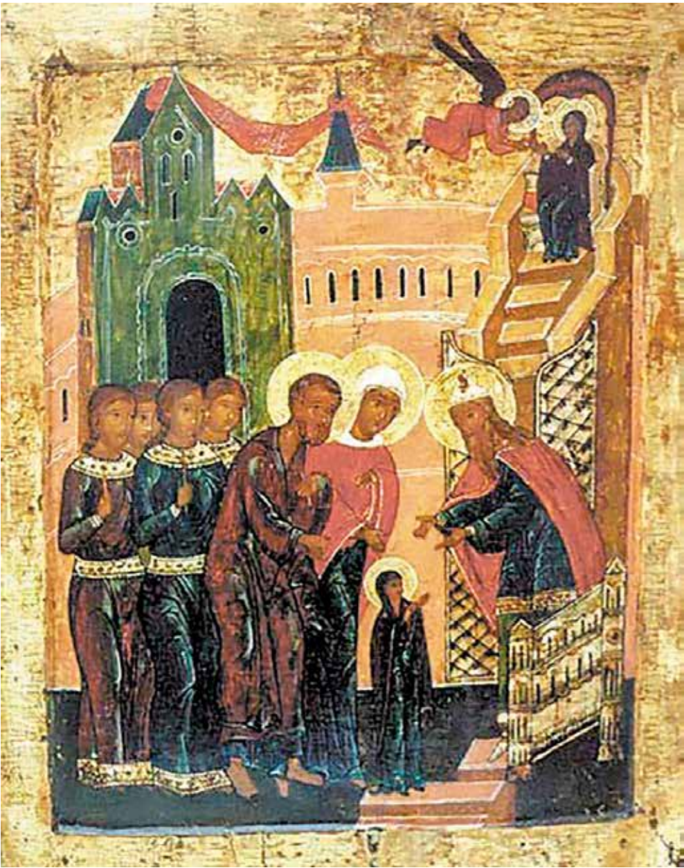
Введение во храм Пресвятой Богородицы (икона, XVI век)

Димитрий Ростовский в конце XVII века составил сочинение «Сказание о Входе во храм Пре-