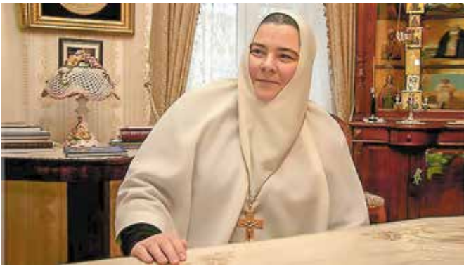
Дорогая и всеми нами любимая Матушка Филарета!

От всей души поздравляем с Днём Тезоименитства!