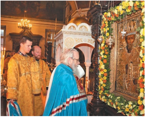
Престольный праздник в Никольском храме на ул. Вене

приходили, он за богослужением был особенно счастлив. И сам непрестанно молился... До последних дней и даже часов своей жизни был весь в трудах и заботах. Буквально перед кончиной Владыка обсуждал новый номер газеты «Православный собеседник». Он был главным редактором и духовным вдохновителем этого бесплатного для прихожан издания. В 1990-е годы, когда Владыка Корнилий принял на себя бремя управления Эстонской Православной Церковью, она переживала непростые времена: отнималось церковное имущество, чрезвычайно трудно было выстраивать отношения с властями. Но в конце концов своей стойкостью он просто переменял отношение к Православной Церкви во всём государстве! У всего населения Эстонии Митрополит Корнилий снискал заслуженные почёт и уважение. С его словом стали считаться все. Это самый авторитетный епископ для всех жителей Эстонии. Соболез-