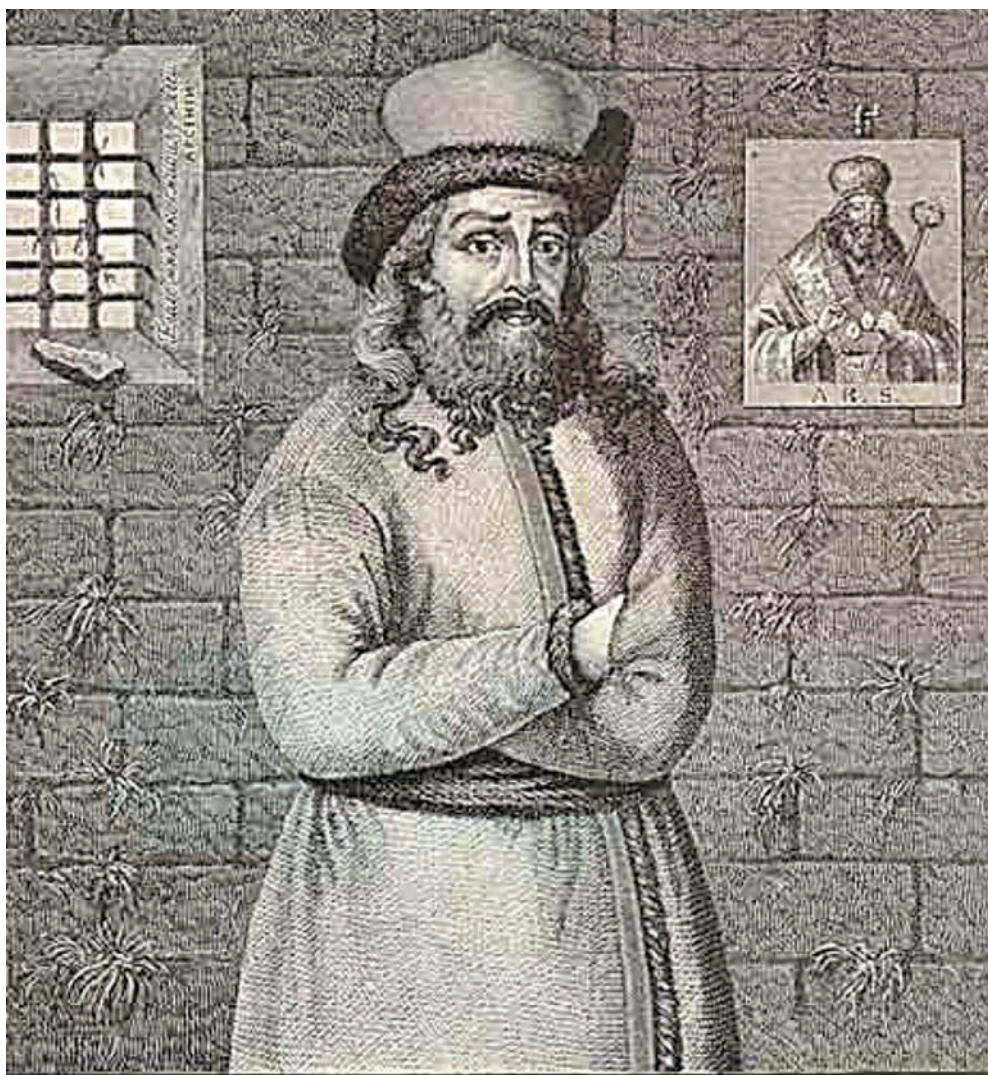
Всякъ образъ Крестный погнѣблющійъ людство, а спасаемъ о Христѣ негатиъ благодатиъ есть.