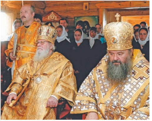
12.08.07. поселок Явас, Мордовия