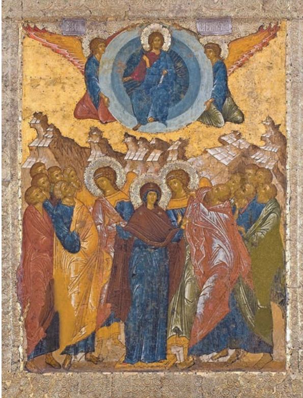
Вознесение Господне. Россия. XV в. Кирилло-Белозерский музей-заповедник