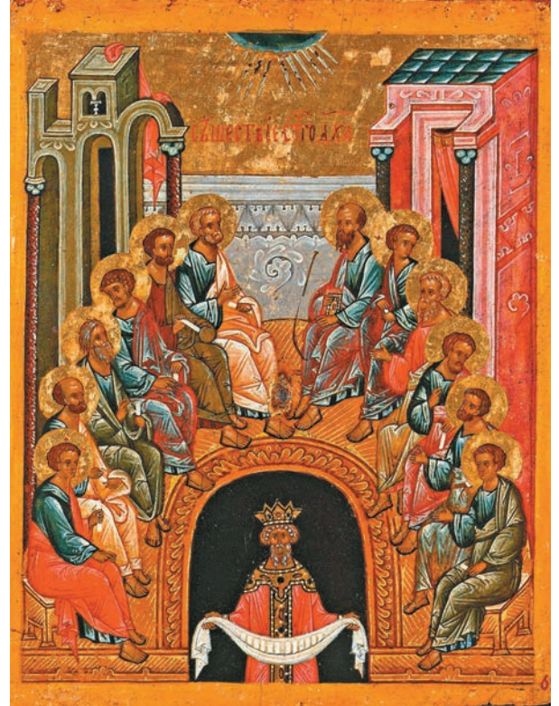
Сошествие Святого Духа на апостолов Конец XV — начало XVI вв. Новгород

На иконе вы видите апостолов, провожающих взглядом Своего Учителя, воздевающих руки к Нему. Апостол Павел, которого еще не могло быть при этих событиях, в силу времени, также изображен здесь, поскольку наряду с апостолом Петром много потрудился в проповеди слова Божия и назван Первоверховным. Здесь он изображен в особенно энергичной скорбной и удивленной позе одной рукой схватившись за голову, воздевает другую к удаляющемуся Господу.