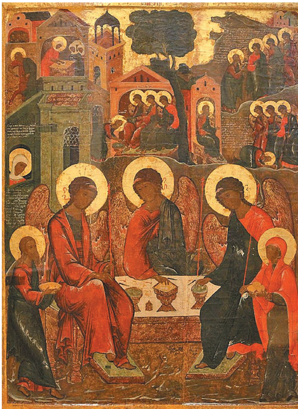
Св. Троица с деяниями 1596 г. Костромской государственный историко-архитектурный и художественный музей

«И явился ему Господь у дубравы Мамре, когда он сидел при входе в шатер [свой], во время зноя дневно-го. Он возвел очи свои и взглянул, и вот, три мужа стоят против него. Увидев, он побежал навстречу им от входа в шатер [свой] и поклонился до земли, и сказал: Владыка! если я