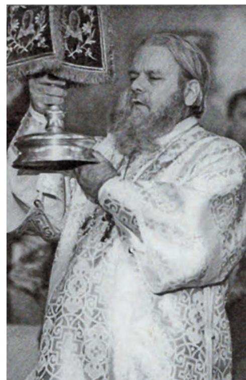
Первая архиерейская Литургия

(по материалам книги Митрополита Корнилия «О моём пути»)